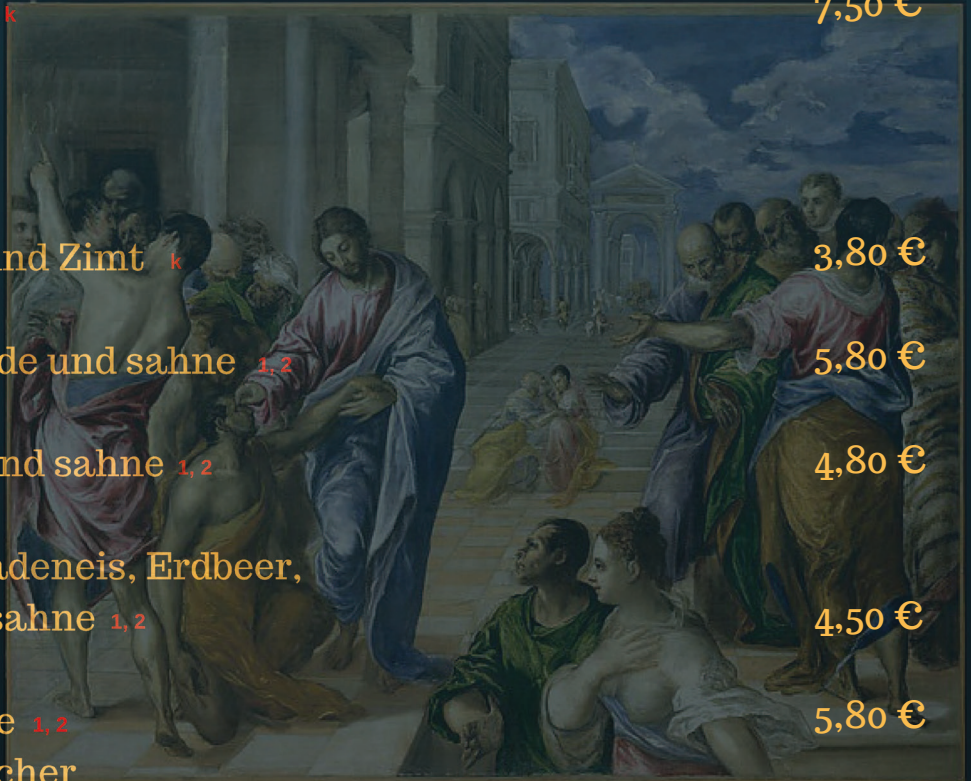
Titel: La curación del ciego, Year: ca. 1570 4,80 €

Alle speisen aus dieser karte können auch zum mitnehmen bestellt werden.