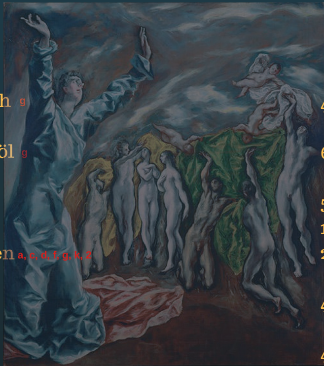
Titel : Visión del Apocalipsis, Year: 1608 - 1614