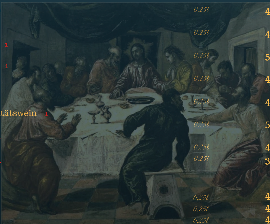
Titel: La última cena, Year 1568