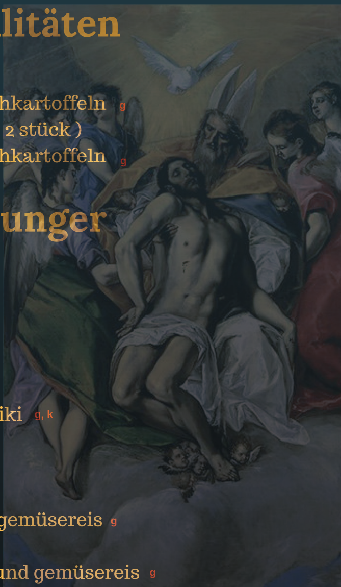
Title: La Trinidad, Year: 1577 - 1579

Alle speisen aus dieser karte können auch zum mitnehmen bestellt werden.