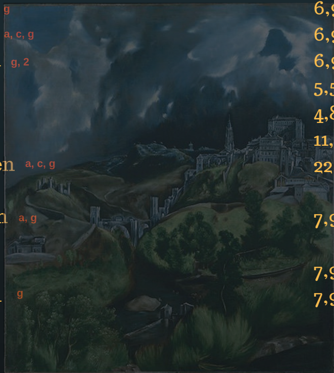
Title : Vista de Toledo, Year: 1596 - 1600

Alle speisen aus dieser karte können auch zum mitnehmen bestellt werden.