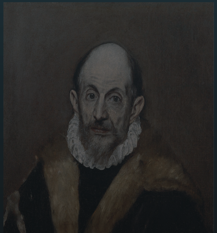
Titel: Retrato de un hombre, Year: 1595-1600 Mutmaßliches Selbstporträt von El-Greco.

**Die hausgemachte Grillsoße kann Spuren von Eiern, Milch, Gluten, Senf, Gewürzen enthalten und enthält Geschmackszusätze und Konservierungsstoffe natürlichen Ursprungs.