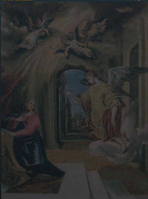
Title: La Anunciación, Year: 1570-1600